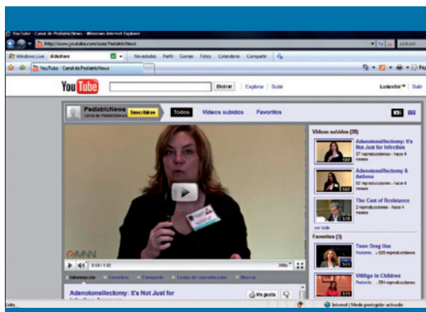
Figura 5. Imagen del canal PediatricNews en Youtube

resto de personas. Los vídeos se publican en formato flash y se les asignan etiquetas (a modo de palabras clave) para que su búsqueda sea más fácil. Además, pueden ser clasificados por categorías como los más vistos o los más recientes entre otros. Al vídeo se le asigna una URL que puede utilizarse para insertarlo en páginas web propias.