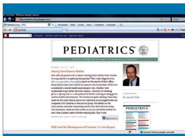
Figura 2. Blog pediátrico de Pediatrics

Existe en la red una gran biblioteca de podcasts de contenido médico disponibles para los usuarios (tabla 4). Éstos constituyen un material potencial para la formación de los profesionales. Hay revisiones de casos, información sobre investigaciones, discursos sobre enfermedades concretas, procedimientos, nuevas técnicas, charlas magistrales, etc. Todo ello puede utilizarse para