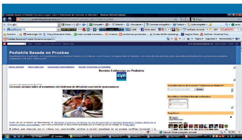
Figura 3. Blog pediátrico de Pediatría Basada en Pruebas