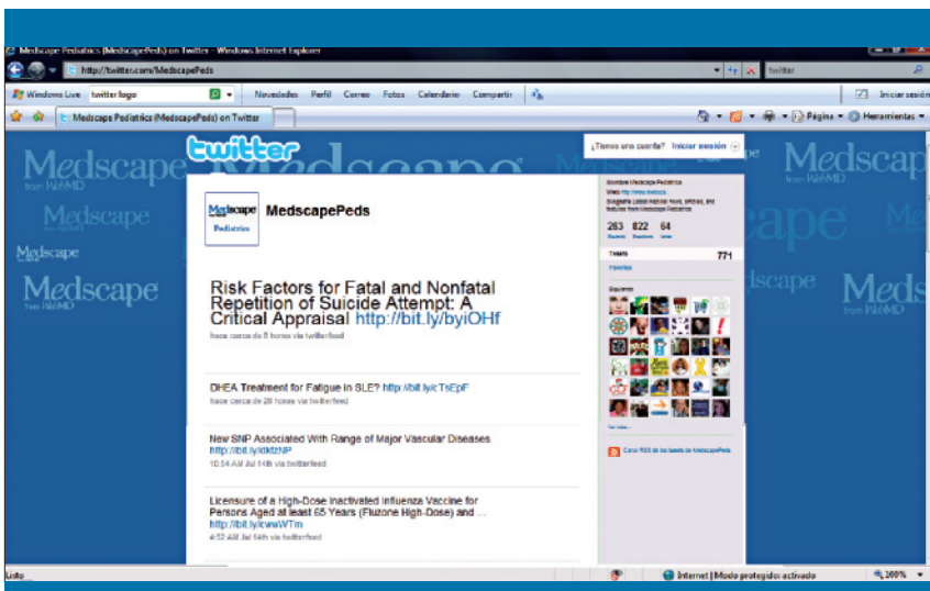
Figura 4. Twitter de Medscape Pediatrics

El espacio que ofrecen estos discos duros virtuales es variable, y será mayor siempre que se pague una cuota. Algunos disponen de un cliente de escritorio que facilita la administración del disco. Otra de las utilidades que presentan es la capacidad de sincronizar el disco duro con nuestro escritorio de modo que podamos elegir las carpetas para que se sincronicen automáticamente de forma diaria, guardando así los cambios realizados en nuestros documentos con actualizaciones automáticas. Por último, una gran ventaja de esta herramienta on line es la posibilidad de compartir archivos pesados. Tras subir un documento, el servicio ofrece una URL pública desde la cual se podrá descargar el archivo; esta URL se podrá compartir con los contactos que queramos. En la tabla 5 se presentan algunos servicios de almacenamiento on line ; DropBox ( http://www.dropbox.com/ ) es uno de los recursos con mayor capacidad (concede 2 GB de disco duro personal en internet) y usabilidad.