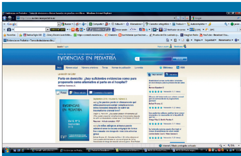
Figura 6. Web site de la revista Evidencias en Pediatría

la Web 2.0 actual, que permitirá que nuestro lenguaje natural pueda ser entendido por los llamados «agentes de software inteligentes». Estos programas serán capaces de integrar, compartir y encontrar la información más fácilmente que en la actualidad, y lo harán acorde a nuestras necesidades, a partir de la interpretación e interconexión de un mayor número de datos. Así, si formulamos la pregunta «quiero conocer los efectos secundarios de la rifampicina en los niños de entre 3 y 5 años con bronquitis asmática», el sistema nos devolverá unos resultados adaptados a esta pregunta, como si se la hubiéramos realizado a un especialista. Como es lógico, para lograr estos resultados en las búsquedas es necesaria la aplicación de la inteligencia artificial, es decir, programas informáticos que emulen métodos de razonamiento análogos a los de los humanos.