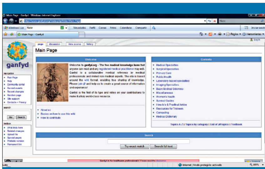
Figura 1. Página de inicio de la wiki médica Ganfyd

se basa en el conocimiento colectivo y crecen con el trabajo común de los distintos usuarios interesados en un mismo tema, manteniendo así el espíritu de la Web 2.0. La palabra wiki procede del hawaiano wiki wiki , que significa rápido. Su construcción es muy simple y rápida, pues se realiza directamente desde el navegador con un procesador de textos sencillo, y no requiere instalar ningún programa de edición específico.