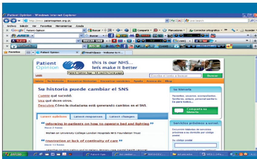
Figura 3. Web Patient Opinion, del National Health Service británico

jas o sugerencias sobre la atención recibida, así como a las encuestas de satisfacción (figura 3).