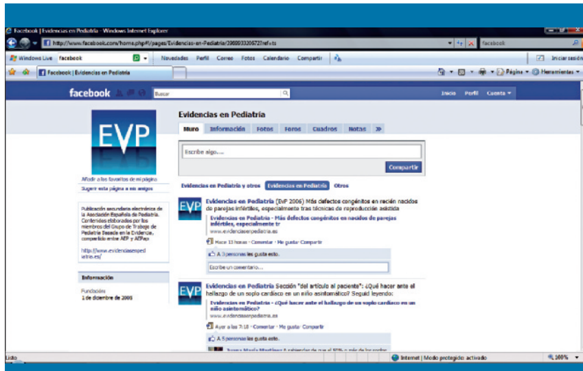
Figura 2. Web del grupo Evidencias en Pediatría en Facebook