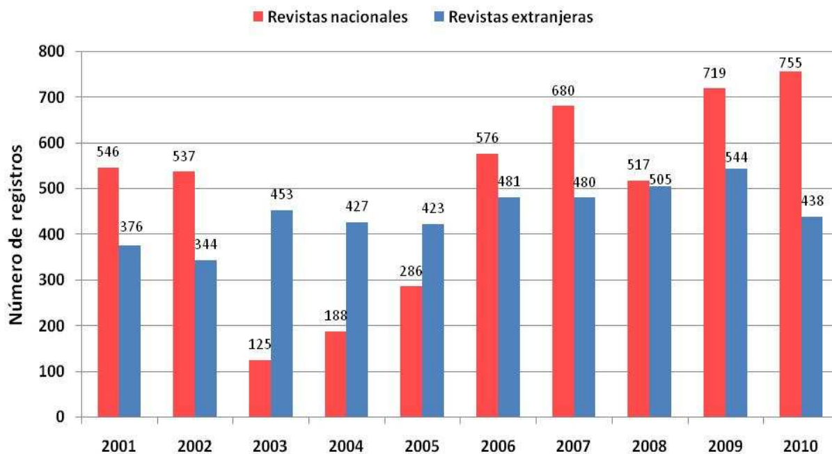
Fig. 4. Producción de Cuba en revistas nacionales y extranjeras según años en Scopus .

Total de contribuciones en revistas nacionales: 4 929.