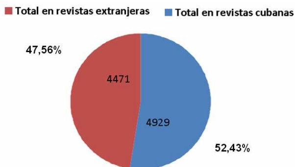
Fig. 3. Porcentaje de artículos de Cuba publicados en revistas nacionales y extranjeras.