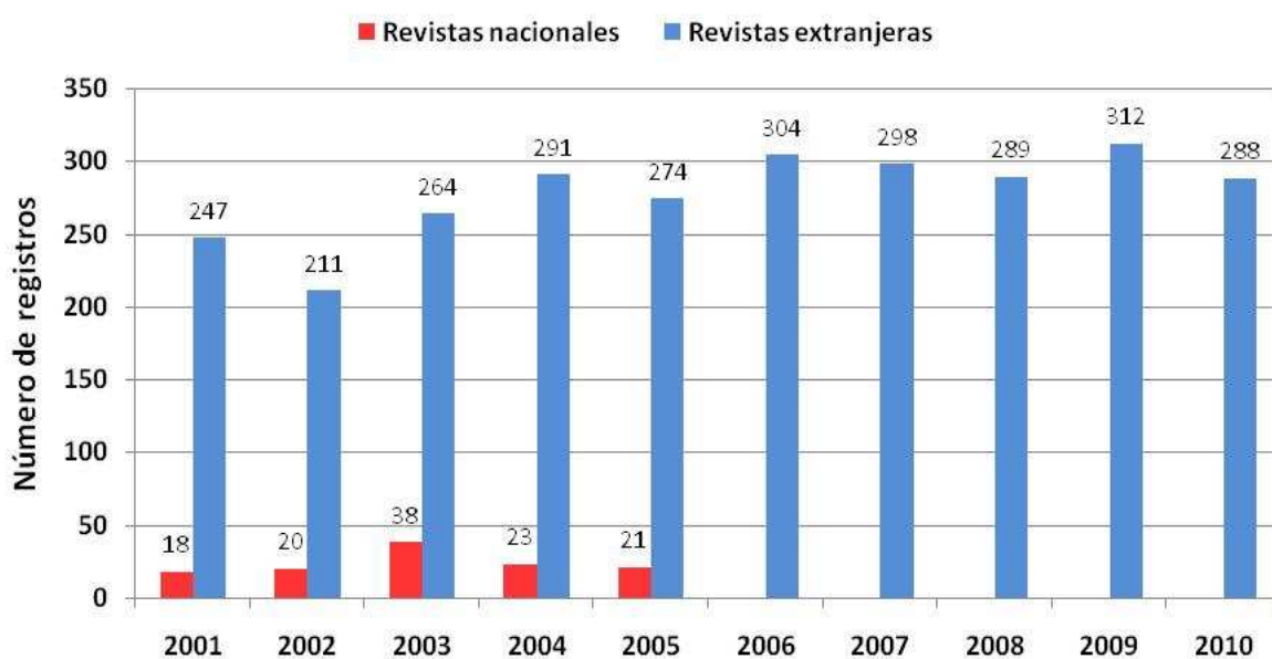
Fig. 5. Producción de Cuba en revistas nacionales y extranjeras según años en PubMed .

Como se dijo antes, el número de artículos procesados por PubMed se mantiene estable a lo largo de los años estudiados. Entre 2001 y 2005, aparecen algunos registros de publicaciones en revistas nacionales, pero, a partir del 2006 y hasta el final del periodo estudiado, la cifra se mantiene en cero, y el ingreso de contribuciones de autores cubanos a la base, se produce en su totalidad a expensas de los artículos publicados en revistas extranjeras (fig. 5).